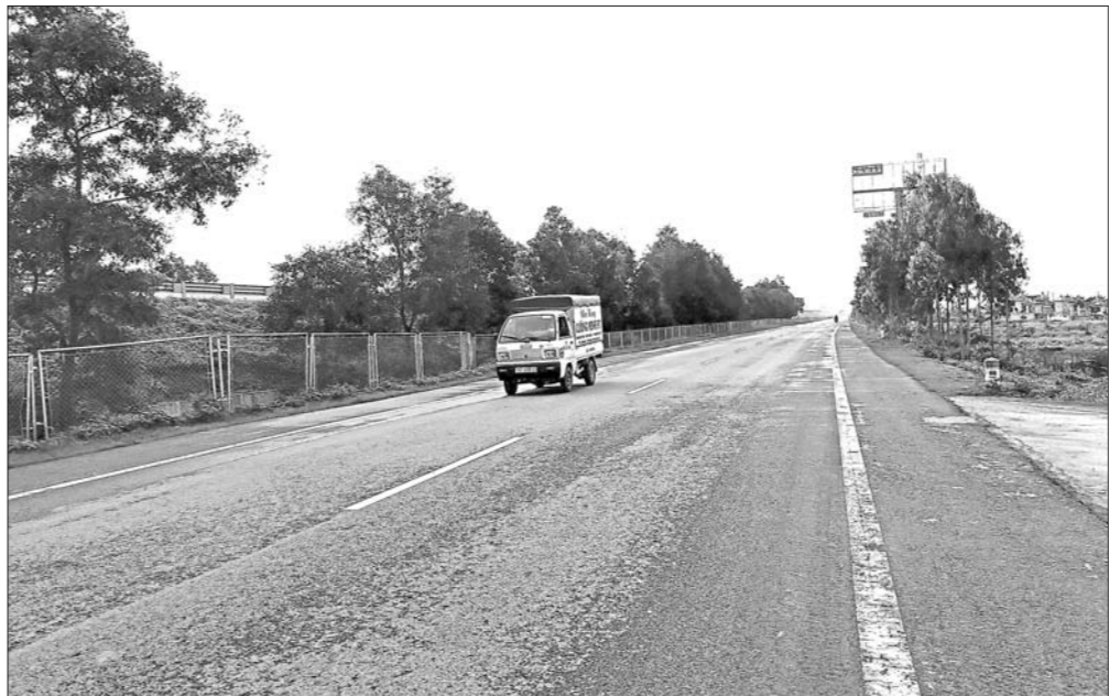
Xây dựng đường mới cùng lúc với làm đường gom sẽ giảm được nhiều khó khăn về sau. Trong ảnh: Đường gom cao tốc Hà Nội - Hải Phòng được xây dựng đồng bộ cùng với đường chính, đã phát huy hiệu quả