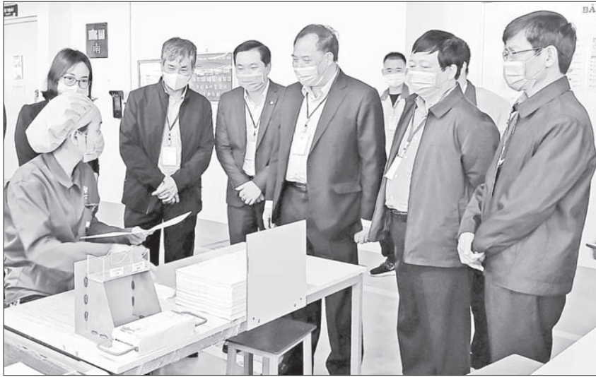
Các đồng chí lãnh đạo tỉnh kiểm tra công tác phòng chống dịch Covid-19 tại Công ty TNHH Sản phẩm giấy Leo Việt Nam