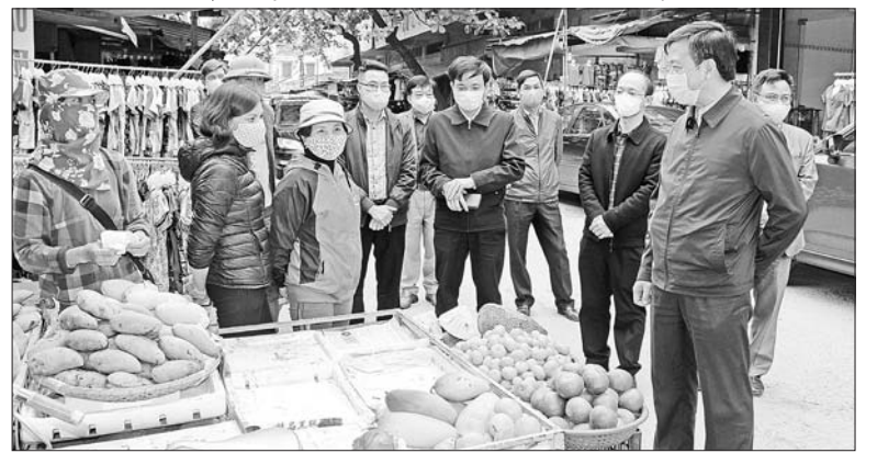
Đồng chí Phó Bí thư Thường trực Tỉnh ủy Phạm Xuân Thăng kiểm tra công tác phòng chống dịch tại chợ Sao Đỏ