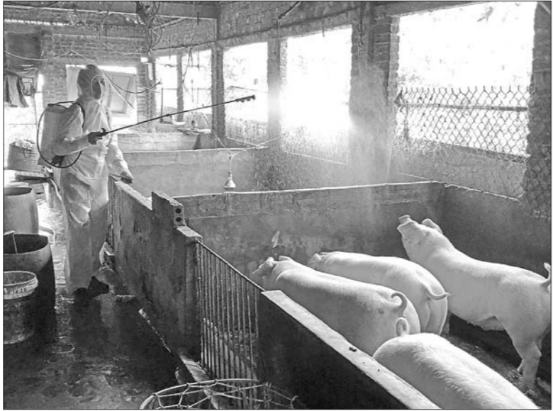
Việc tái đàn cần tính toán đến an toàn trong chăn nuôi

trước khi DTLCPC xảy ra, phần lớn các hộ trong xã đều chăn nuôi lợn nhưng nay chỉ khoảng 30% số hộ tái đàn với số lượng ít. Toàn xã chỉ còn 2.000 con lợn với khoảng 150 hộ chăn nuôi. "Giá con giống cao trong khi tìm mua rất khó khăn. Nhiều trại nuôi lợn lớn đều giữ lại con giống để mở rộng quy mô chăn nuôi, còn nếu mua giống ở các trại nhỏ thì nguồn gốc không bảo đảm", ông Vỹ nói.