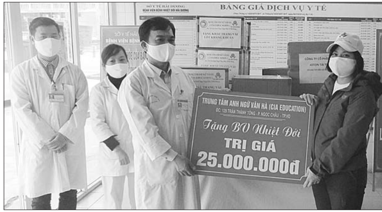
Trung tâm Anh ngữ Văn Hà trao tặng 1.500 khẩu trang, 10 bộ quần áo bảo hộ phòng dịch cho Bệnh viện Bệnh nhiệt đới tỉnh

Trước đó, Ban An toàn giao thông tỉnh dự kiến trong tháng 4 sẽ tổ chức khám sức khỏe và